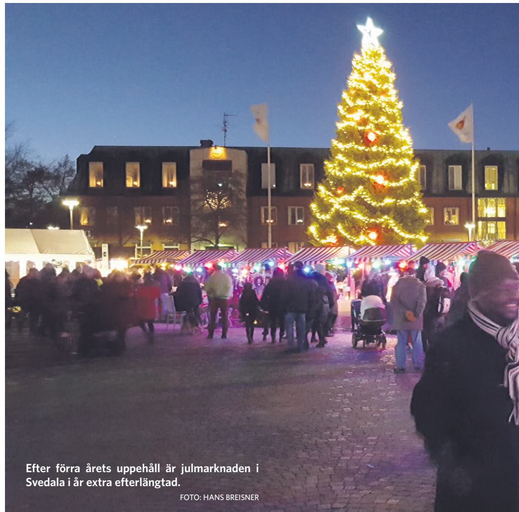
Efter förra årets uppehåll är julmarknaden i Svedala i år extra efterlängtat.

Att julmarknaden i år sker en lördag hänger bland annat samman med att julmarknaden i Baraska hålls dagen därpå, söndag den 5 december.