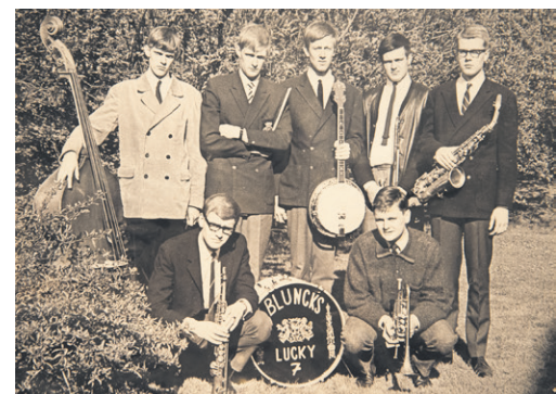
Tidigt i karriären spelade Mikael Wiehe jazz i bandet Bluncks Lucky 7.