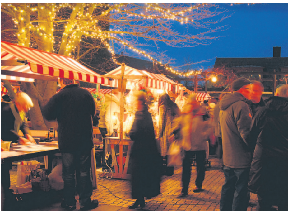
Mat, dryck, pyssel och sång är några av hållpunkterna.