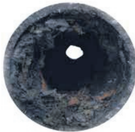
VI SNACKAR INTE SKIT...