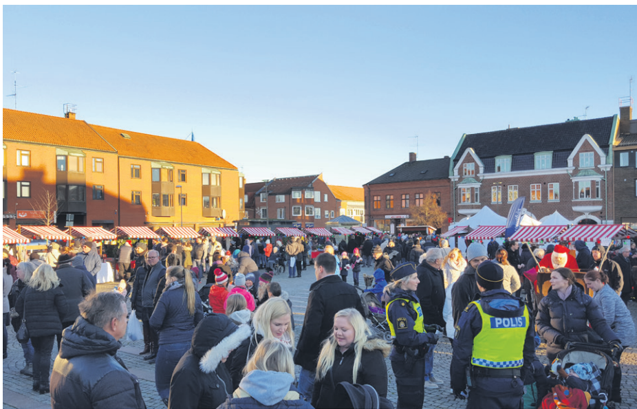
Lördag 4 december är det åter dags för julmarknad på torget.