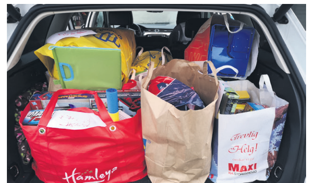
Klart för leverans.