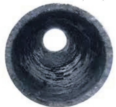
VI SPOLAR BORT DET...